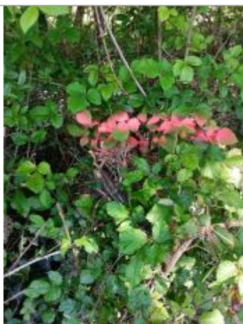
Vue de la laisse - auteur : AGERIN