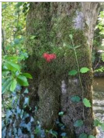
Vue de la laïsse - auteur : AGERIN

Altitude calculée de l'eau (en m) : 119.42