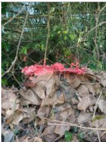
Vue de la laisse - auteur : AGERIN