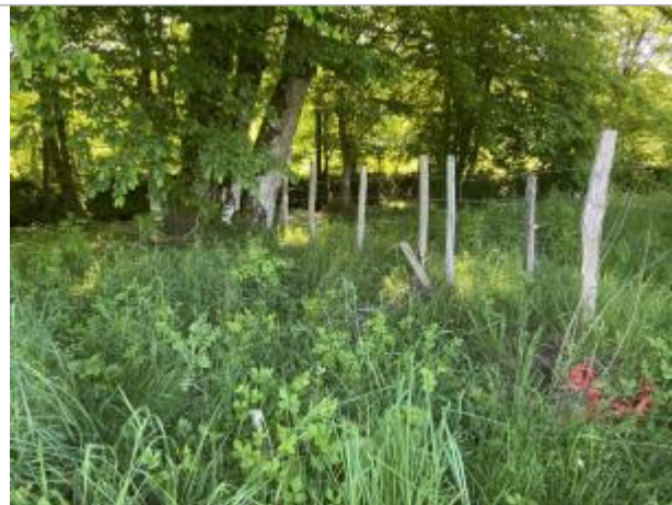
Vue du site - auteur : AGERIN

Coordonnées WGS84 : X: 1.41733900 / Y: 45.28926530