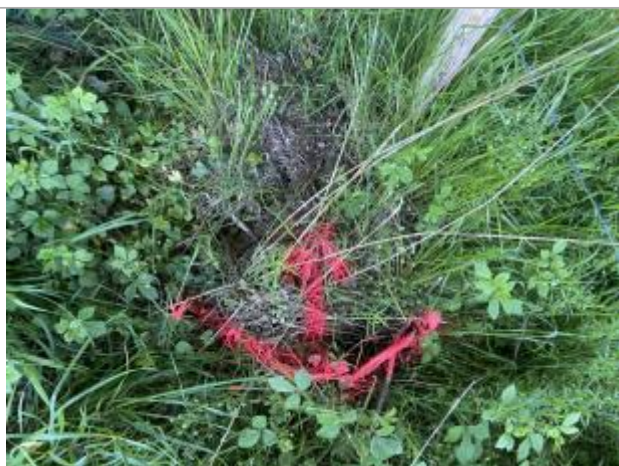
Vue de la laisse - auteur : AGERIN

Altitude calculée de l'eau (en m) : 130.511