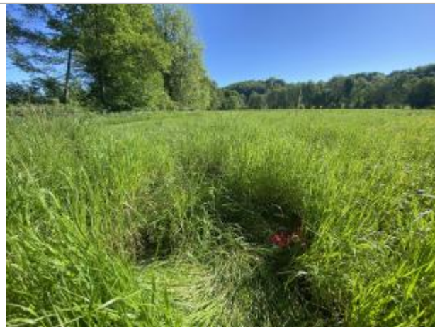
Vue du site - auteur : AGERIN

Coordonnées WGS84 : X: 1.41605010 / Y: 45.28393770