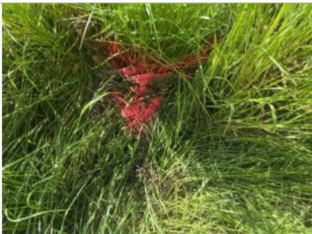
Vue de la laisse - auteur : AGERIN

Altitude calculée de l'eau (en m) : 127.377