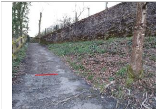
Chemin d'accès à la voie ferrée en amont du Boel

Coordonnées WGS84 : X: -1.75237255 / Y: 47.99623030