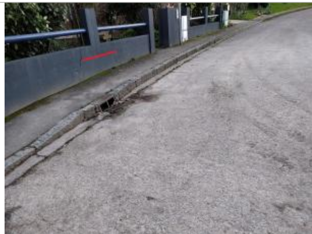
Pont-Réan au bout de la rue des vignes

Coordonnées WGS84 : X: -1.77241457 / Y: 47.99907180