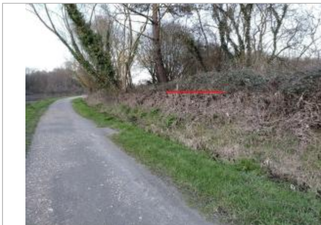
Chemin de halage au niveau du lieu-dit La Bodrais

Coordonnées WGS84 : X: -1.78513024 / Y: 48.00644980