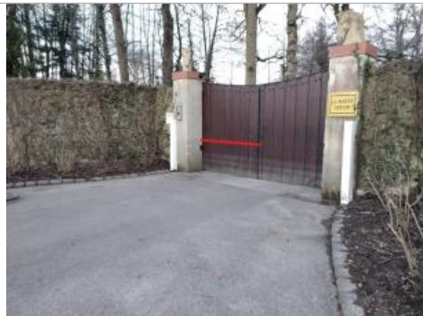
Portail à l'entrée de la propriété La rivière Kersan