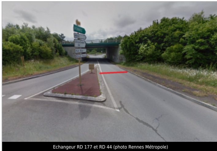
Echangeur RD 177 et RD 44

Coordonnées WGS84 : X: -1.78274117 / Y: 48.02436800