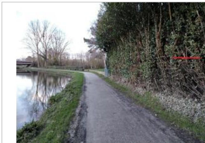
Chemin de halage en aval de la RD177