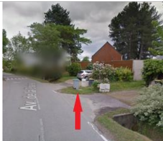
Lotissement Cicé-Blossac, devant le n°21 avenue de la Chaise

Coordonnées WGS84 : X: -1.76727790 / Y: 48.03355730