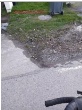
Relevé de la laisse d'inondation

Altitude calculée de l'eau (en m) : 19.96