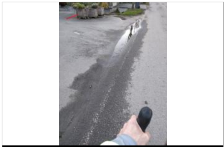
Relevé de la laisse d'inondation

GÉNÉRAL Code : SPC_35047_016_2025 Date de mise à jour : 29/08/2025 Auteur : SPC VCB