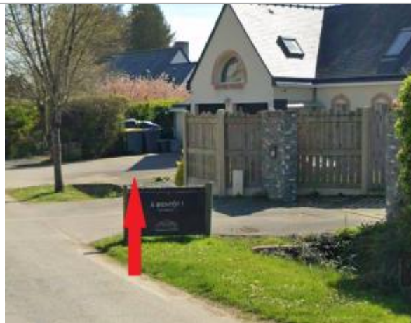
Lotissement Cicé-Blossac, devant le n°37 avenue de la Chaise

Coordonnées WGS84 : X: -1.76892824 / Y: 48.03498170