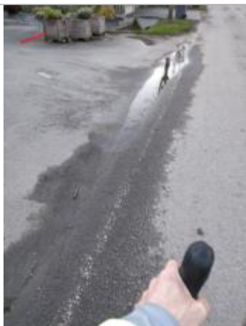
Relevé de la laisse d'inondation