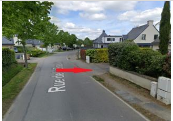
rue de la Giraudais devant le n°8

Coordonnées WGS84 : X: -1.76460718 / Y: 48.03726010