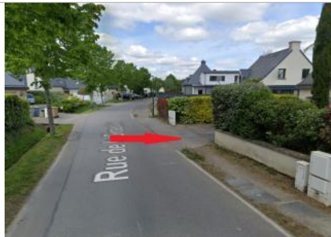
vue de la Giraudais devant le n°8