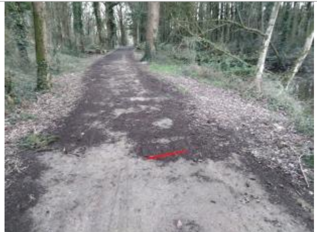
Chemin forestier dans le bois de Cicé

Coordonnées WGS84 : X: -1.76544439 / Y: 48.04407480