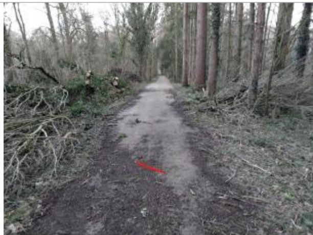
Chemin forestier dans le bois de Cicé

Coordonnées WGS84 : X: -1.76556002 / Y: 48.04506690