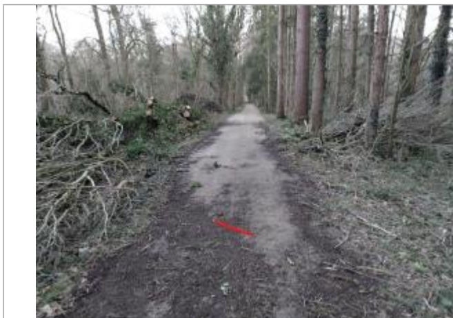
Chemin forestier dans le bois de Ciccé