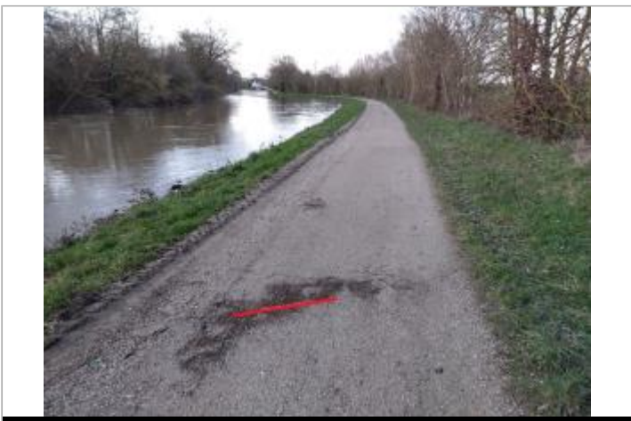
Chemin de halage au niveau du chêne rond

GÉOLOCALISATION Coordonnées WGS84 : X: -1.76633445 / Y: 48.04666820 Coordonnées RGF93 (Lambert 93) X: 345057.41 / Y: 6782525.42 Coordonnées RGF93 (ETRS89) : X: -1.7663345 / Y: 48.0466682 Code Hydro: J---0060 Rive de référence: Gauche