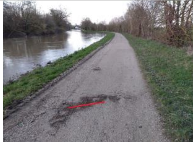
Chemin de halage au niveau du chêne rond

Coordonnées WGS84 : X: -1.76633445 / Y: 48.04666820