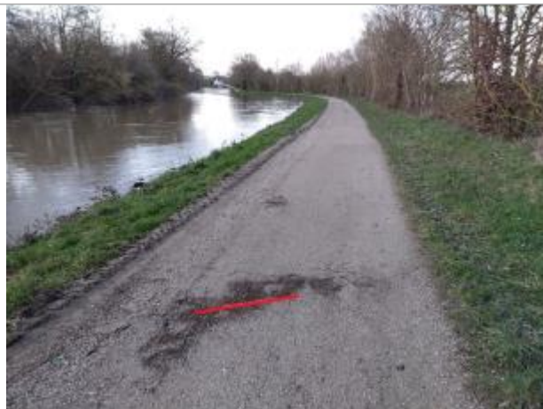
Chemin de halage au niveau du chêne rond

Coordonnées WGS84 : X: -1.76633445 / Y: 48.04666820