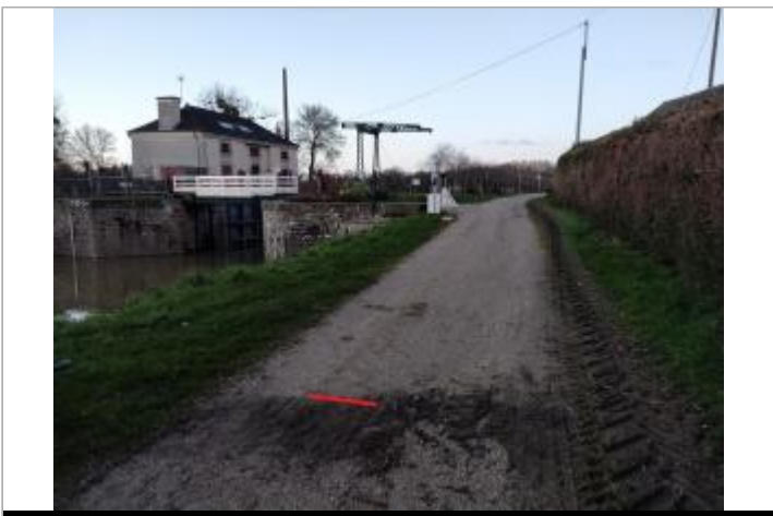
Chemin de halage en aval de l'écluse de Ciccé

GÉOLOCALISATION Coordonnées WGS84 : X: -1.76665169 / Y: 48.05065110 Coordonnées RGF93 (Lambert 93) X: 345060.51 / Y: 6782968.64 Coordonnées RGF93 (ETRS89) : X: -1.7666517 / Y: 48.0506511 Code Hydro: J---0060 Rive de référence: Gauche