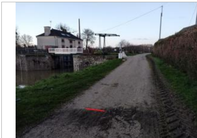
Chemin de halage en aval de l'écluse de Ciccé

Coordonnées WGS84 : X: -1.76665169 / Y: 48.05065110