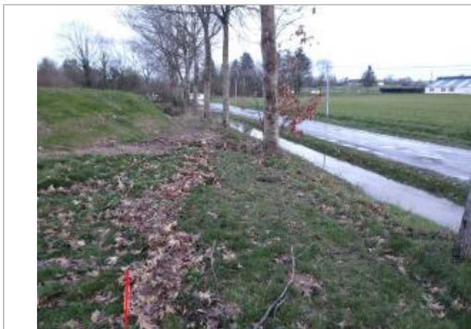
Relevé de la laisse sur le coté de la route

Coordonnées WGS84 : X: -1.77426751 / Y: 48.05612690