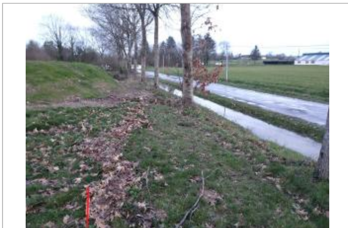
Relevé de la laisse sur le coté de la route