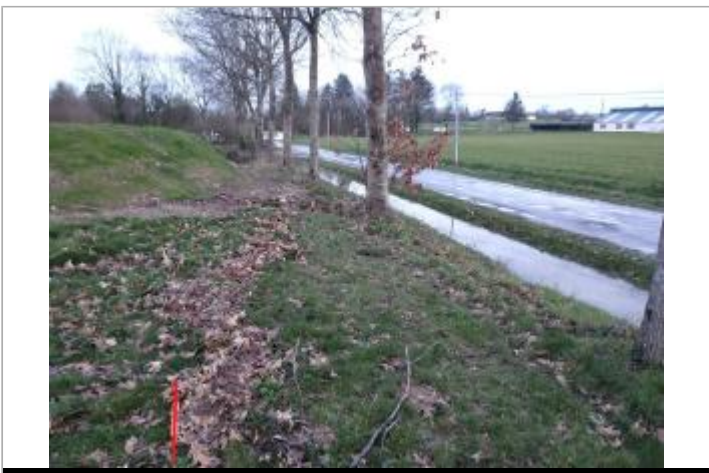
Relevé de la laisse sur le coté de la route

GÉOLOCALISATION Coordonnées WGS84 : X: -1.77426751 / Y: 48.05612690 Coordonnées RGF93 (Lambert 93) X: 344530.87 / Y: 6783610.29 Coordonnées RGF93 (ETRS89) : X: -1.7742675 / Y: 48.0561269 Code Hydro: J---0060 Rive de référence: Droite