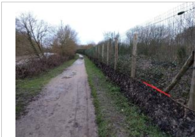
Chemin entre les étangs de Turçe et la Sablière

Coordonnées WGS84 : X: -1.77185280 / Y: 48.05592510