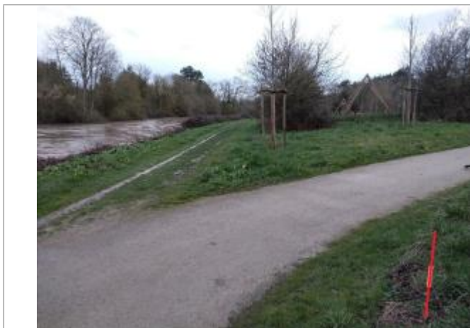
Chemin entre les étangs de Babelouse