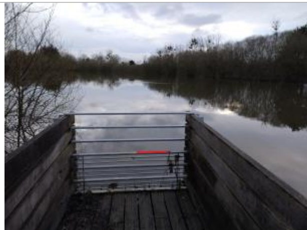
Ponton de l'étang du Bois de Babelouse

Coordonnées WGS84 : X: -1.76780952 / Y: 48.06020520