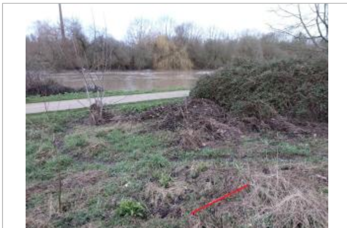
Laisse d'inondation sur le coté du chemin