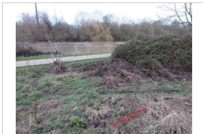
Laisse d'inondation sur le coté du chemin

GÉOLOCALISATION Coordonnées WGS84 : X: -1.76723371 / Y: 48.06251760 Coordonnées RGF93 (Lambert 93) X: 345096.79 / Y: 6784287.53 Coordonnées RGF93 (ETRS89) : X: -1.7672337 / Y: 48.0625176 Code Hydro: J---0060 Rive de référence: Droite