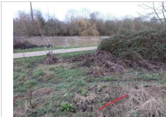
Laisse d'inondation sur le coté du chemin

Coordonnées WGS84 : X: -1.76723371 / Y: 48.06251760