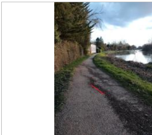
Laisse d'inondation sur le chemin de halage

Coordonnées WGS84 : X: -1.75762068 / Y: 48.06854860