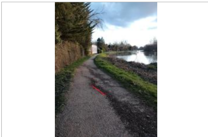
Laisse d'inondation sur le chemin de halage