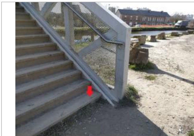
Relevé sur les marches de la passerelle Saint-Martin

Coordonnées WGS84 : X: -1.67548010 / Y: 48.12409660