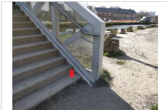
Relevé sur les marches de la passerelle Saint-Martin