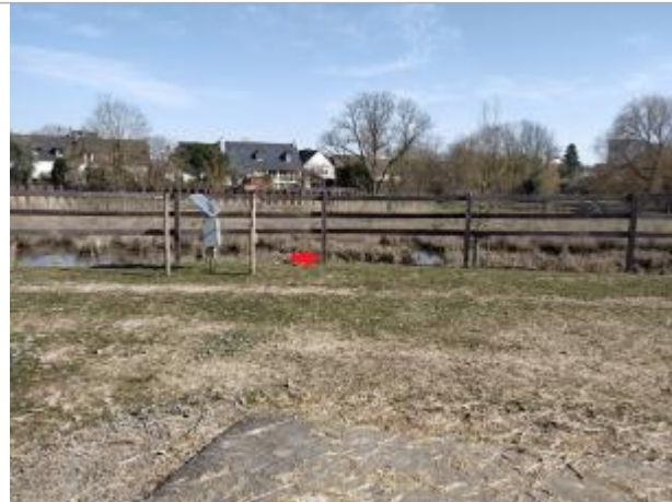
GAEC du canal dans les prairies Saint-Martin