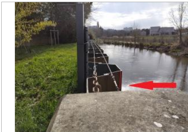
rideau de palplanches au bout de la rue des folies