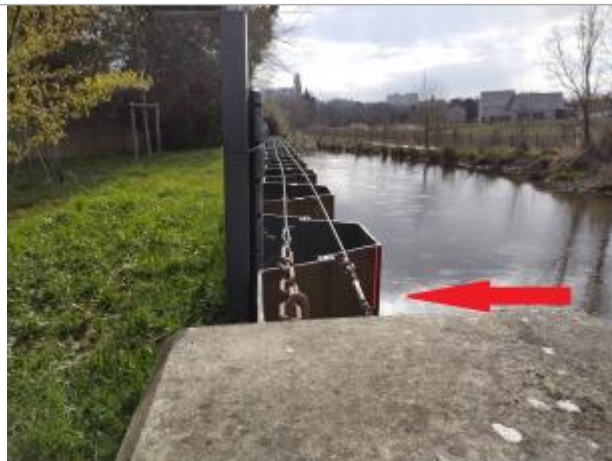
rideau de palplanches au bout de la rue des folies