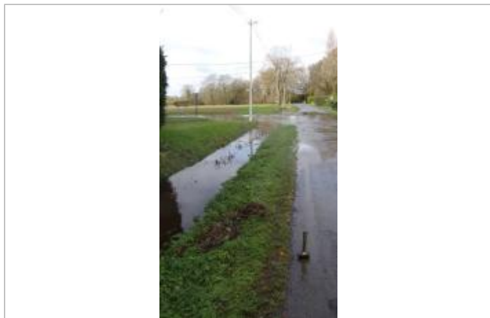
route de Terron vers la Frêche Rondel le 30/01/2025

Altitude calculée de l'eau (en m) : 28.851 m