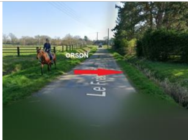
route C8 vers La Frêche Rondel

Coordonnées WGS84 : X: -1.64967556 / Y: 48.06203220