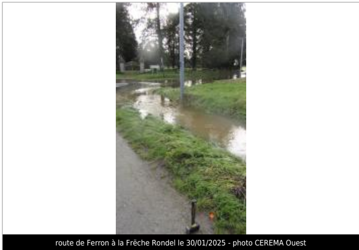
route de Ferron à la Frèche Rondel le 30/01/2025