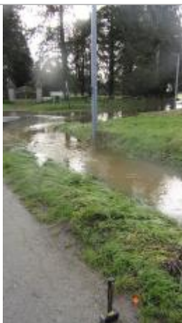
route de Ferron à la Frêche Rondel le 30/01/2025

Altitude calculée de l'eau (en m) : 28.772 m