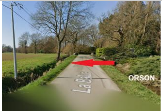
route C8 au niveau de La Balue

Coordonnées WGS84 : X: -1.65029375 / Y: 48.06221660