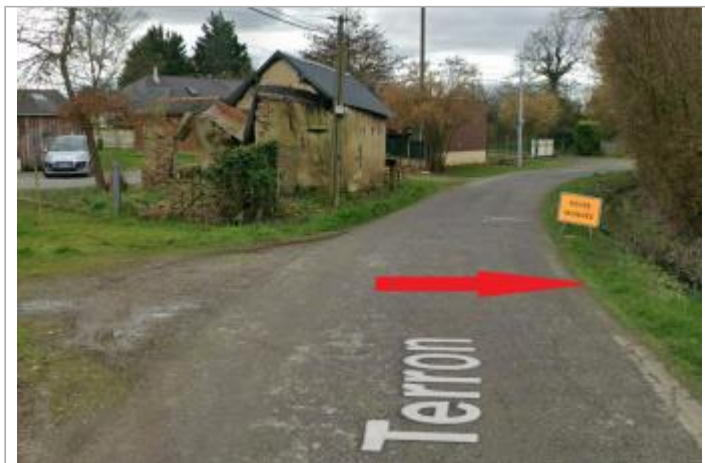
dans les virages route au lieu-dit "Le Terron"