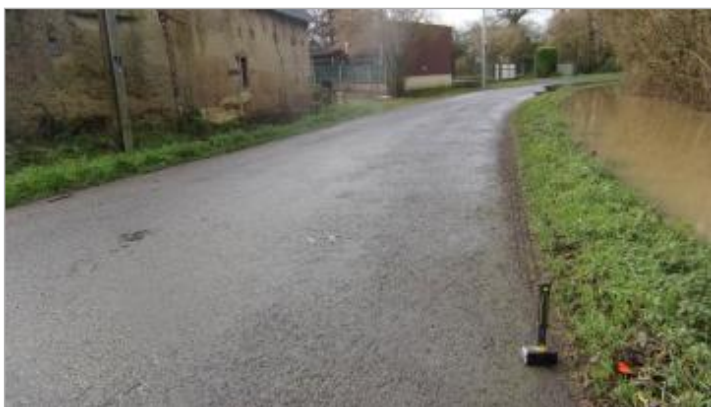
virages au lieu-dit "Terron" le 30/01/2025