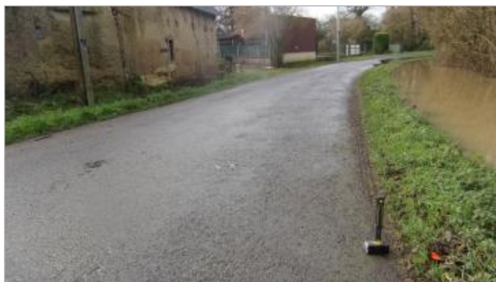
virages au lieu-dit "Terron" le 30/01/2025 - photo CEREMA Ouest

Altitude calculée de l'eau (en m) : 29.093