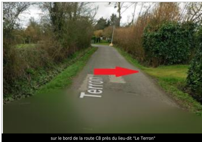
sur le bord de la route C8 près du lieu-dit "Le Terron"