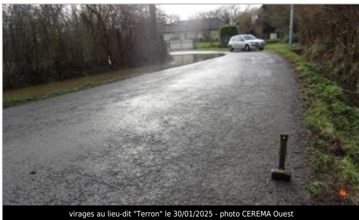
virages au lieu-dit "Terron" le 30/01/2025