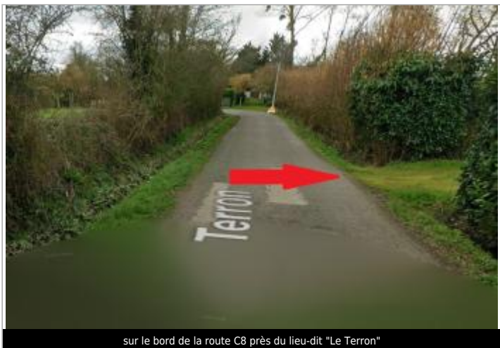
sur le bord de la route C8 près du lieu-dit "Le Terron"

GÉOLOCALISATION Coordonnées WGS84 : X: -1.65452871 / Y: 48.06550650 Coordonnées RGF93 (Lambert 93) X: 353497 / Y: 6784118.52 Coordonnées RGF93 (ETRS89) : X: -1.6545287 / Y: 48.0655065 Code Hydro: J74-0300 Rive de référence: Droite