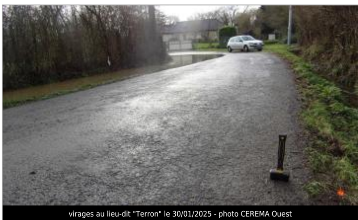
virages au lieu-dit "Terron" le 30/01/2025

GÉNÉRAL Code : SPC_35206_047_2025 Date de mise à jour : 02/10/2025 Auteur : SPC VCB