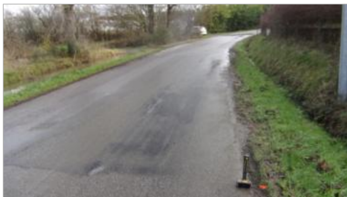
route au niveau du n°2 Launay Hyon lors du relevé