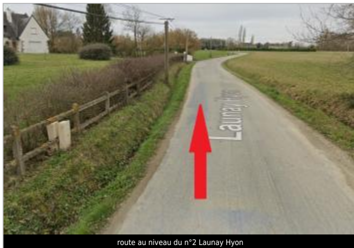
route au niveau du n°2 Launay Hyon

Coordonnées WGS84 : X: -1.66186104 / Y: 48.06770760