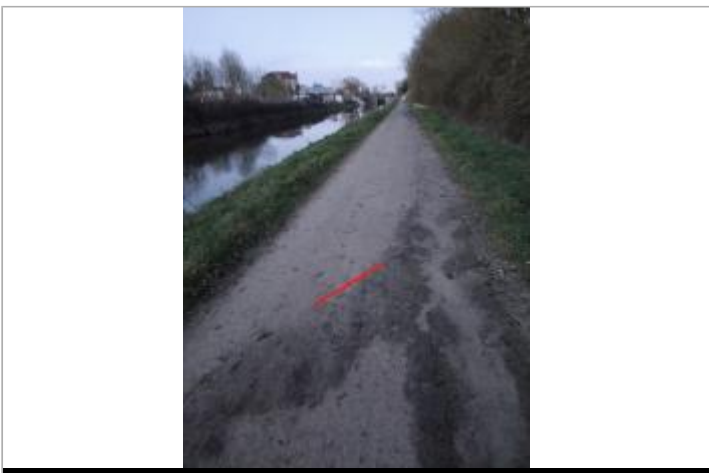
Relevé de l'inondation sur le chemin de halage

GÉOLOCALISATION Coordonnées WGS84 : X: -1.74939093 / Y: 48.09252400 Coordonnées RGF93 (Lambert 93) X: 346623.96 / Y: 6787536 Coordonnées RGF93 (ETRS89) : X: -1.7493909 / Y: 48.092524 Code Hydro: J---0060 Rive de référence: Gauche