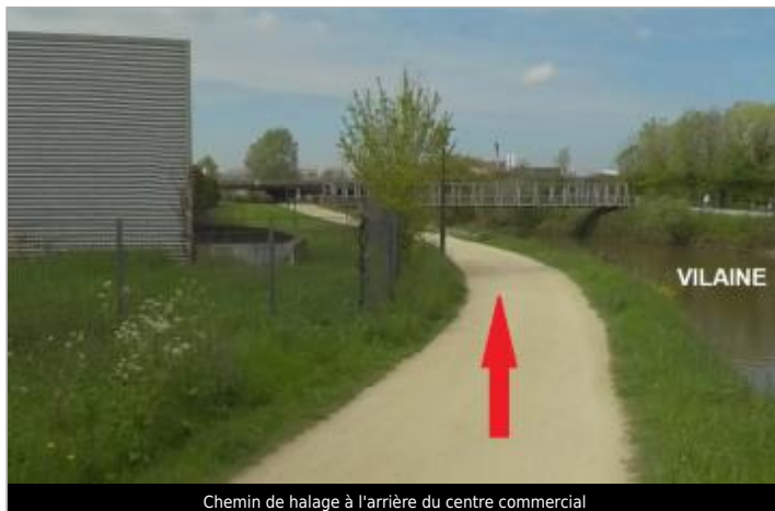
Chemin de halage à l'arrière du centre commercial

Coordonnées WGS84 : X: -1.71494556 / Y: 48.10621650