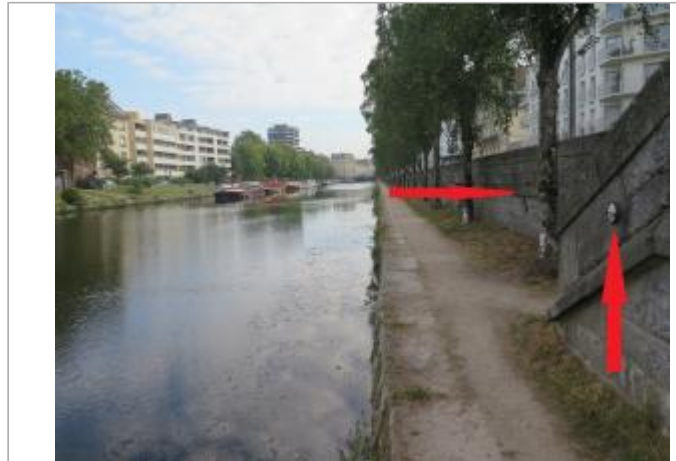
Quai de la Prévalaye escalier face à la rue des Trente