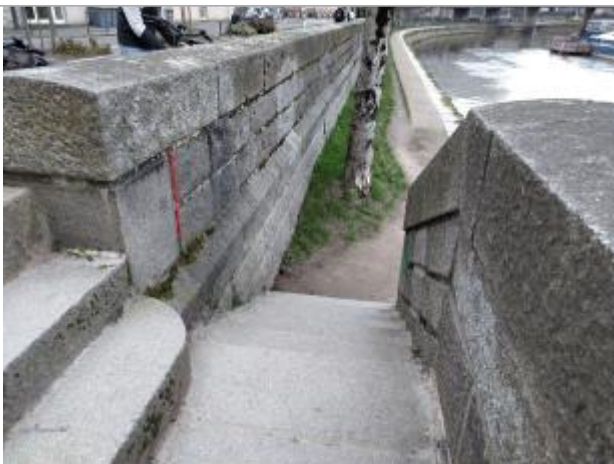
Relevé de la laisse d'inondation quai de la Prévalaye face à la rue des Trente

Altitude calculée de l'eau (en m) : 24.91 m