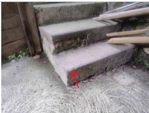
Vue sur la 1ère marche de l'escalier (niveau atteint par le Clain en mars 2020).

Organisme : Etablissement public du bassin de la Vienne