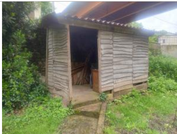
Vue sur le cabanon

Coordonnées WGS84 : X: 0.35931000 / Y: 46.61804400