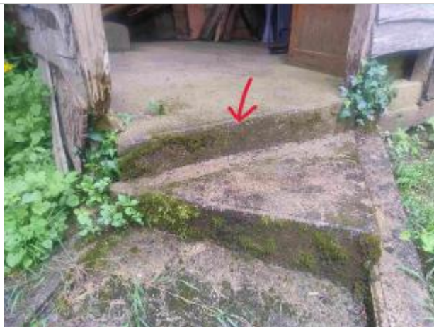
Vue sur la marche identifiée dans le témoignage des propriétaires. (flèche rouge correspond à la hauteur de l'eau en février 2024)

Organisme : Etablissement public du bassin de la Vienne