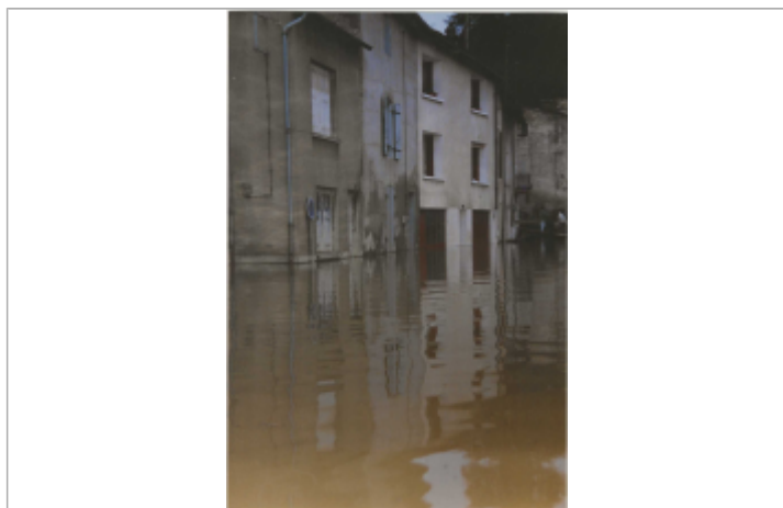
Vue sur le 24 rue de Lessart en 1995

Altitude calculée de l'eau (en m) : 68.29 m