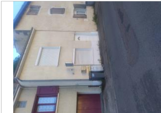
Vue sur l'habitation (24 rue de Lessart)