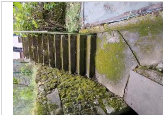
Vue sur l'escalier (12 rue de Clotet)

Coordonnées WGS84 : X: 0.35935600 / Y: 46.61820900