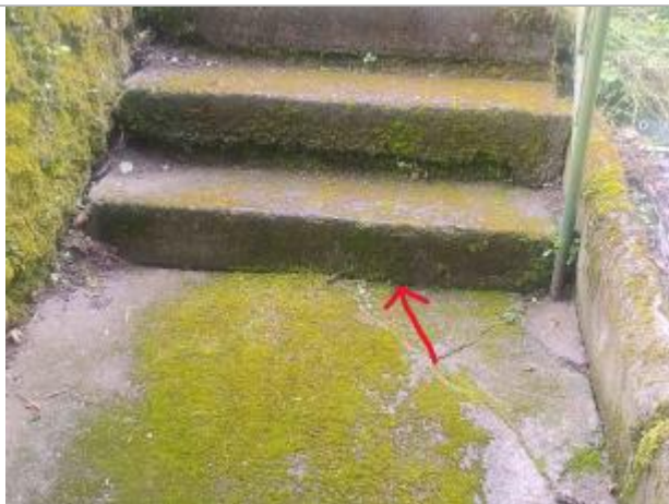
Indication du niveau d'eau atteint (2024) selon le témoignage

Organisme : Etablissement public du bassin de la Vienne