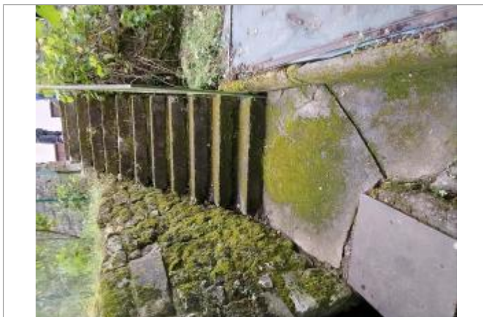
Vue sur l'escalier (12 rue de Clotet)