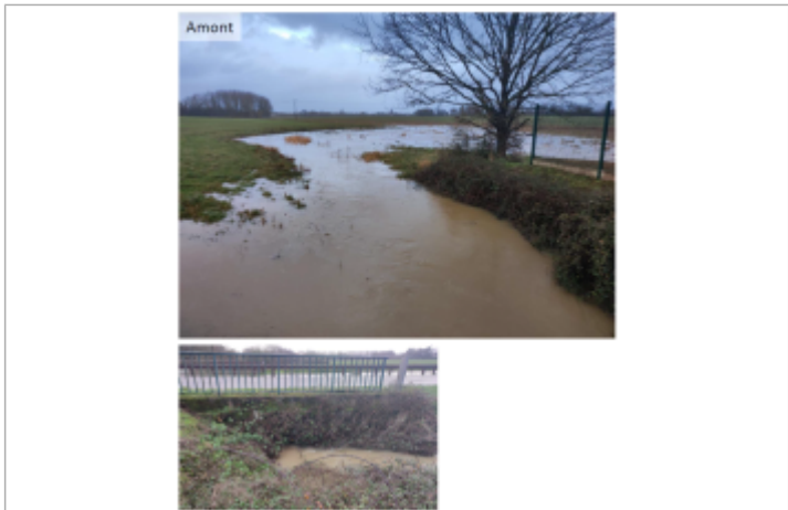
Inondation de l'Orson le 8 janvier 2025