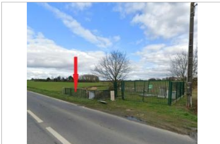
Amont du pont de la RD 82 sur l'Orson