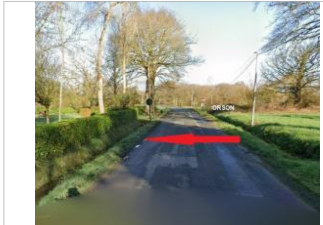
bord de la route C3

Coordonnées WGS84 : X: -1.67404270 / Y: 48.04525140