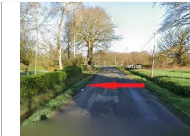
bord de la route C3

Coordonnées WGS84 : X: -1.67404270 / Y: 48.04525140