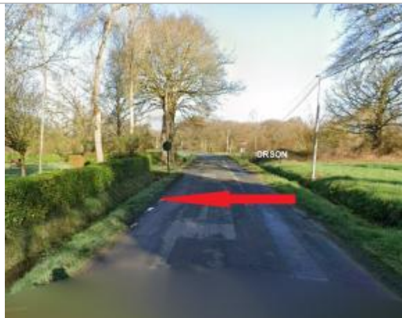
bord de la route C3