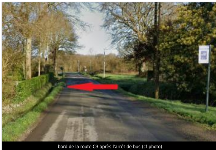
bord de la route C3 après l'arrêt de bus (cf photo)

Coordonnées WGS84 : X: -1.67378454 / Y: 48.04498700