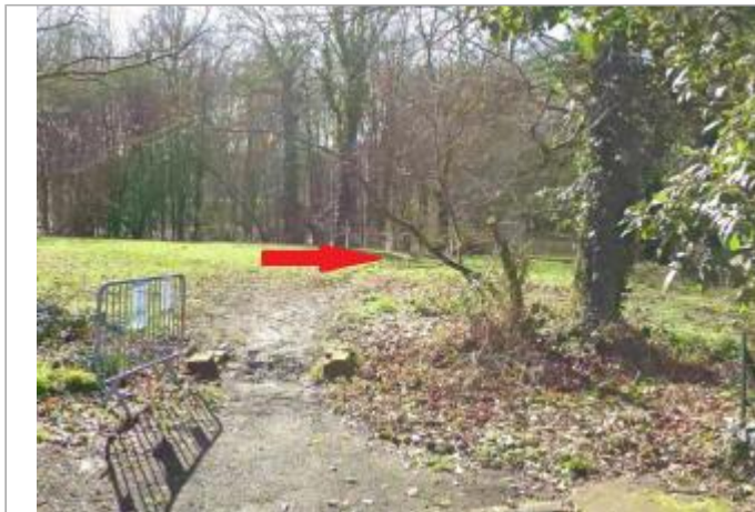
Chemin vers la Seiche au bout de la rue Bourvil