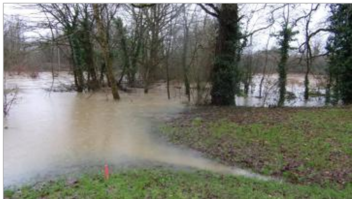
Chemin vers la Seiche au bout de la rue Bourvil le 29/01/2025

SOURCE DE REPÉRAGE : RENNES MÉTROPOLE RELEVÉS LAISSES 2025 - 28/02/2025